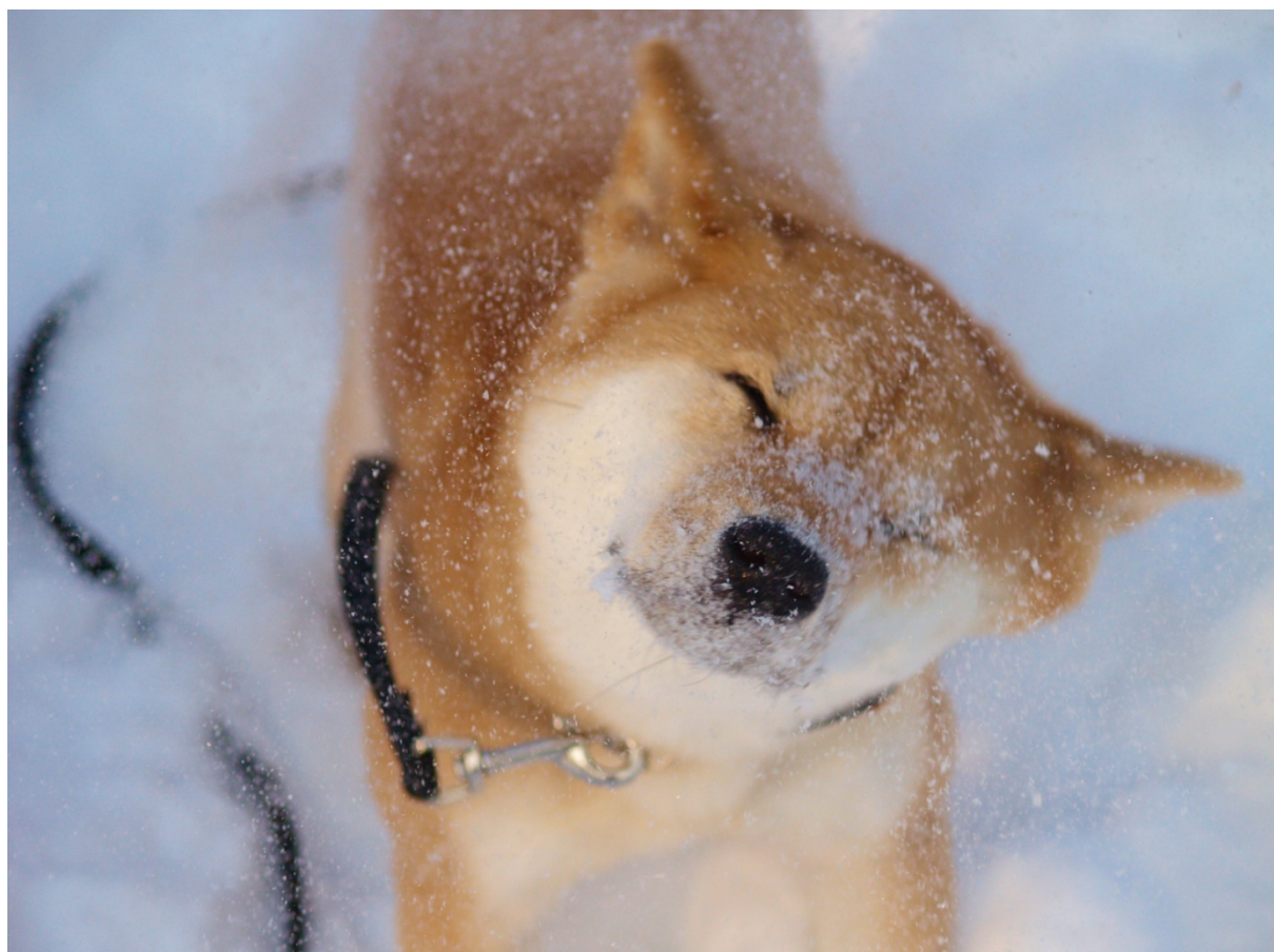
Shiban Zumi skakar av sig snön